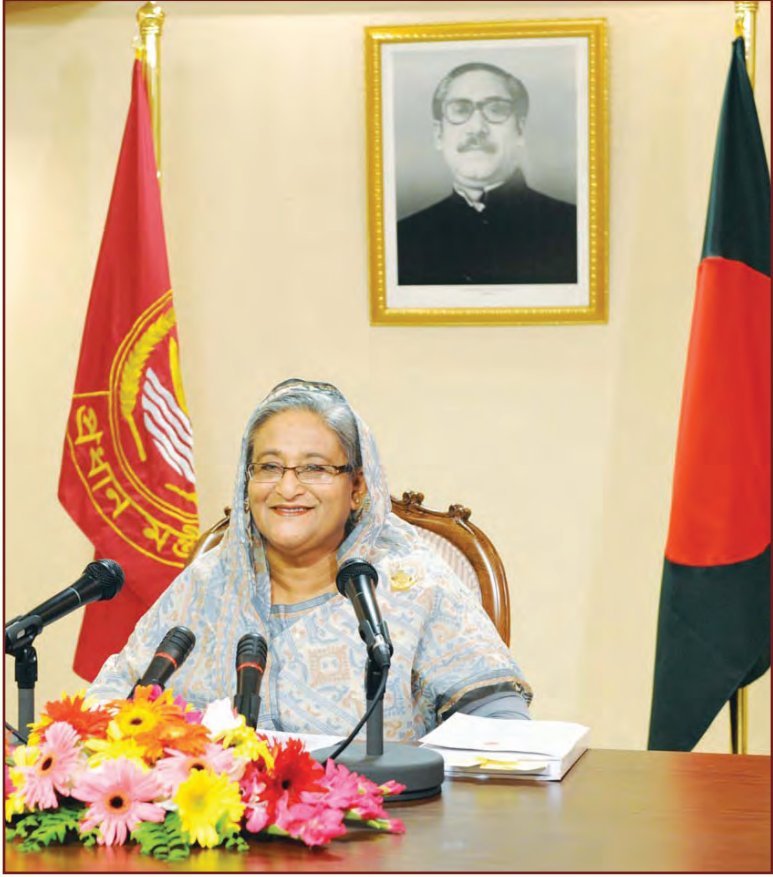
গণপ্রজাতন্ত্রী বাংলাদেশ সরকারের মাননীয় প্রধানমন্ত্রী শেখ হাসিনা